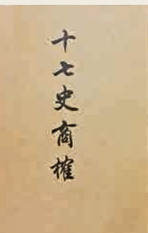
▲《史學舉例》序內提及的《十七史商榷》和《廿二史考異》