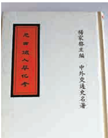
▲台版《元西域人華化考》，由陳寅恪作序