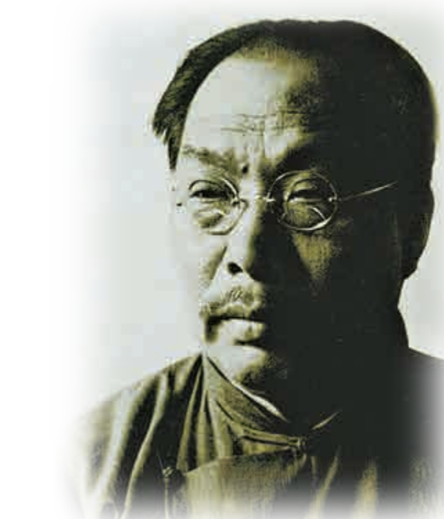
◀陳垣（見圖）與陳寅恪並稱為史學「二陳」，二陳又與呂思勉、錢穆並稱為「史學四大家」

，除陳垣《校勘學釋例》，亦可翻閱校勘權威張舜微的《廣校略》、《校勘學發微》、《中國古代史籍校讀法》及王叔岷的《辨讎學》及《辨讎別錄》等書。