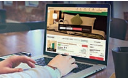
▲訂酒店除了考慮價錢外，同時亦要考慮是否包括餐飲等其他服務

現時市面上有多個機票、酒店格價網站，不少旅客免得麻煩，都會選擇直接經這些格價網站連結到有關酒店旅遊平台，惟Trivago早前被澳洲競爭及消費委員會入稟法院控告其廣告涉及誤導，推薦的價格並非最低價格。香港消委會提醒，切勿盡信格價網站的資訊，建議透過酒店官方網站，或其他銷售平台列出的酒店房間規格、房價及所包括的其他服務，作出比較後再選擇最適合自己