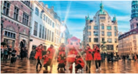
▲長假是到外地旅遊的好時機

，看盡所有的優惠代碼喇。里先生還提醒，部分優惠代碼有一定的限制，如要更多折扣或須連續預定兩晚，抑或是須達到一定金額，旅客在使用優惠代碼前可留意相關資訊。