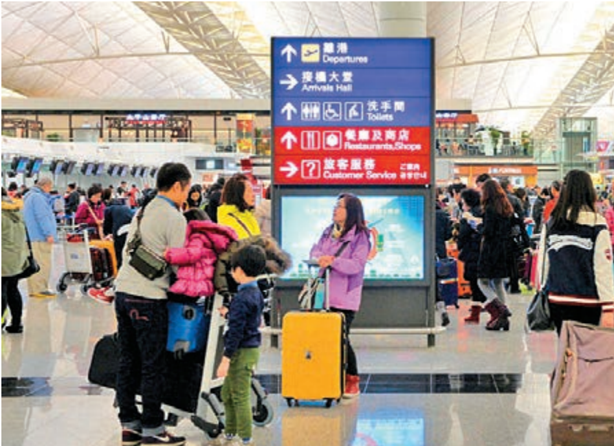
▲只要善用酒店優惠，新春期間旅遊亦能找到慳錢好方法