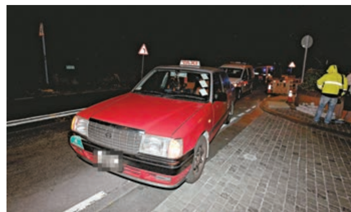
▲赤柱發生罕見的士司機「無錢找」糾紛