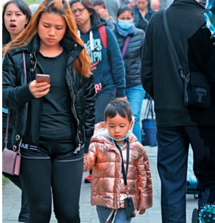
▲流感高峰期殺到，預防勝於治療，兒童在人多地方最好戴口罩，如未接種疫苗應及早打流感針