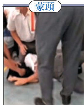
▲仁濟醫院董之英紀念中學再有一段懷疑欺凌片段傳出

教育局局長楊潤雄日前表示，教育局對欺凌事件「零容忍」的態度十分清晰；他又指教育局一直透過通告和指引，要求學校必須正視校園欺凌，採取積極措施，確保學生在校安全。