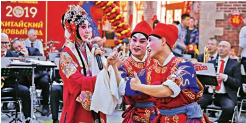
◀表演者在中國年活動上展示山西晉城上黨梆子《拾花轎》

近年來，中俄邊境線上的文化活動逐年增多，爲中俄兩國民間友好往來搭建起平台。中國駐哈巴羅夫斯克總領館總領事崔國說，舉辦「絲路歡聚中國年」活動就是雙方人文交流縮影體現。