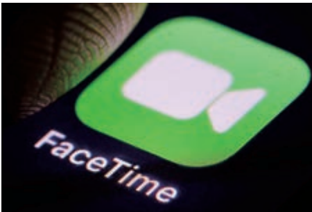
▲FaceTime日前被發現存在嚴重漏洞，用戶可能被監聽

蘋果去年夏天發布FaceTime群組視訊通話功能，雖曾在iOS 12操作系統的早期測試版本中短暫移除，但去年10月再次推出。