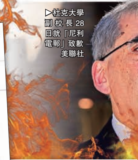
►杜克大學副校長28日就「尼利電郵」致歉