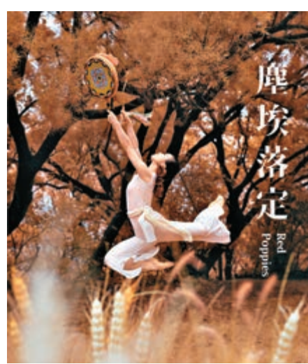
▲藏族民族舞劇《塵埃落定》今年第四度公演，訴說雪域高原民族愛恨情仇