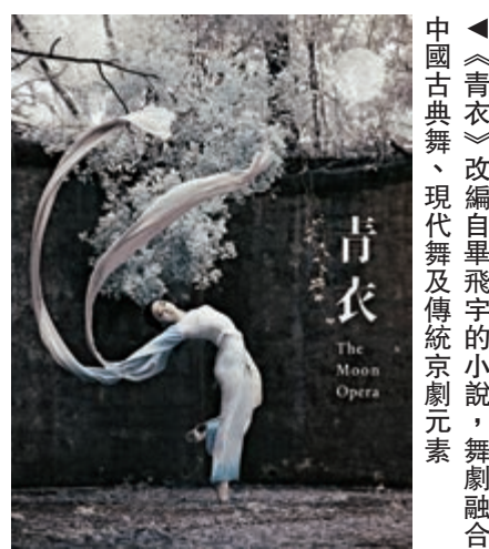
▲《青衣》改編自畢飛宇的小說，舞劇融合中國古典舞、現代舞及傳統京劇元素