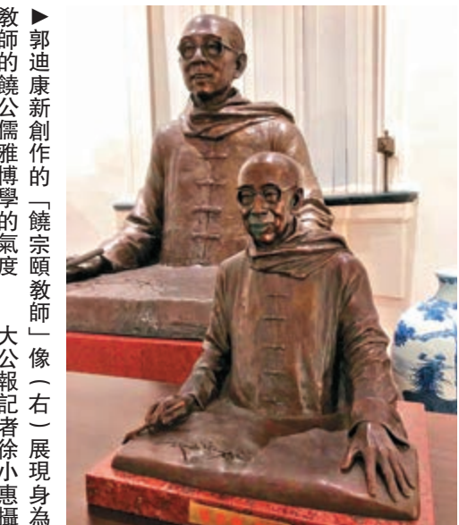
▲郭迪康新創作的「饒宗頤教師」像（右）展現身為教師的饒公儒雅博學的氣度