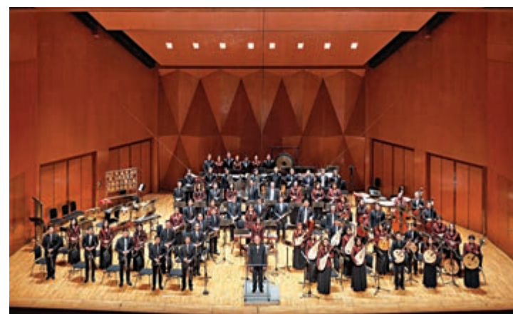
▲將赴加國賀歲演出的香港愛樂民樂團