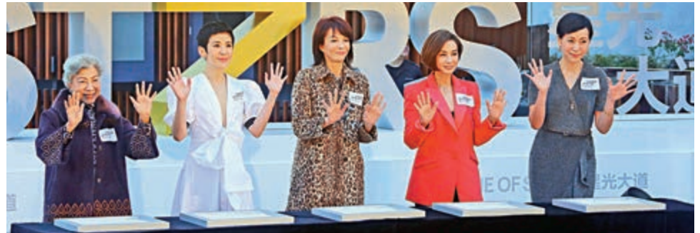
▲星光大道新增多位名人的掌印，包括九位金像獎影后。左起：羅蘭、吳君如、鄭裕玲、毛舜筠、葉童等

立法會旅遊界議員姚思榮估計星光大道翻新後，新鮮感可維持兩、三年，長遠需不斷增添新元素以維持熱度，例如增設現場表演，也可擺設具本地特色的非物質文化遺產，如2008年傳遞奧運聖火的龍舟等。