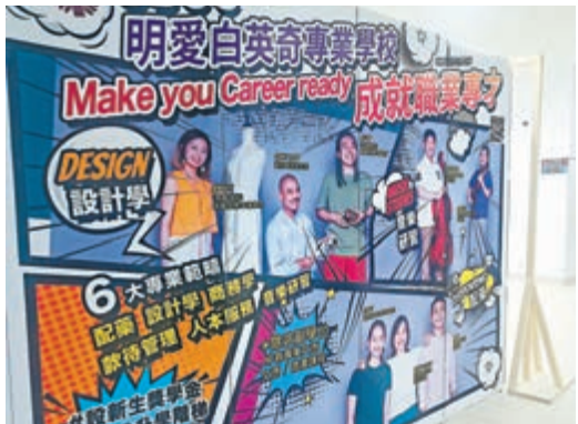
▲明愛白英奇專業學校在今學年已積極招收副學位學生