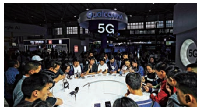
在在去年舉辦的貴陽數博會上，參觀者在高通展位感受5G上網體驗 資料圖片