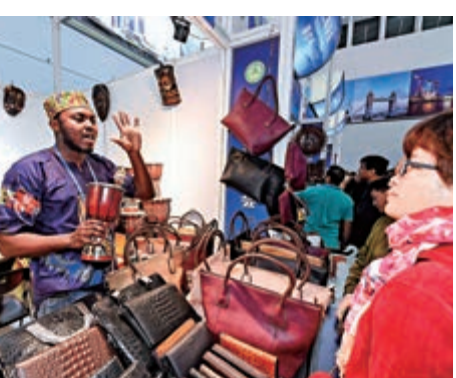
▲顧客在海南「冬交會」「一帶一路」國際館選購商品 資料圖片

【大公報訊】記者倪巍上海報道：國際評級機構穆迪發給大公報一份名為《中國「一帶一路」倡議，「一帶一路」記錄卡：深化聯繫的同時也需謹慎》的最新研報稱，自2013年中國首次提出「一帶一路」倡議以來，參與「一帶一路」合作的國家數量已增長至115個，較2013年的64個幾乎翻番。「一帶一路」成員國作為中國重要貿易夥伴的可能性已經提高。