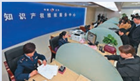
▲中國義烏（小商品）知識產權快速維權中心工作人員為企業辦理業務 資料圖片

在例行記者會上予以駁斥，希望美方以開放包容心態看待其他國家的科技發展與進步。他並表示，中方願同美方進一步加強科技領域的交流與合作，更好造福兩國人民和世界人民。