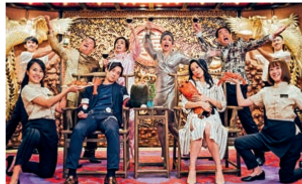
▲《你咪理，我愛你!》眾星雲集，載歌載舞