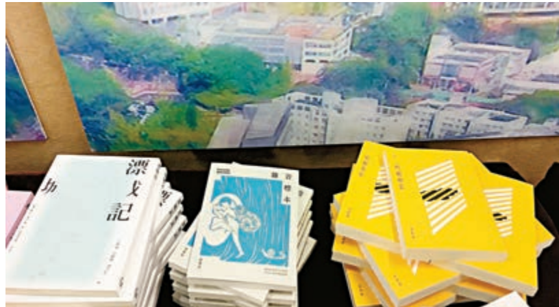
◀部分「華文獎」往屆得主著作書籍