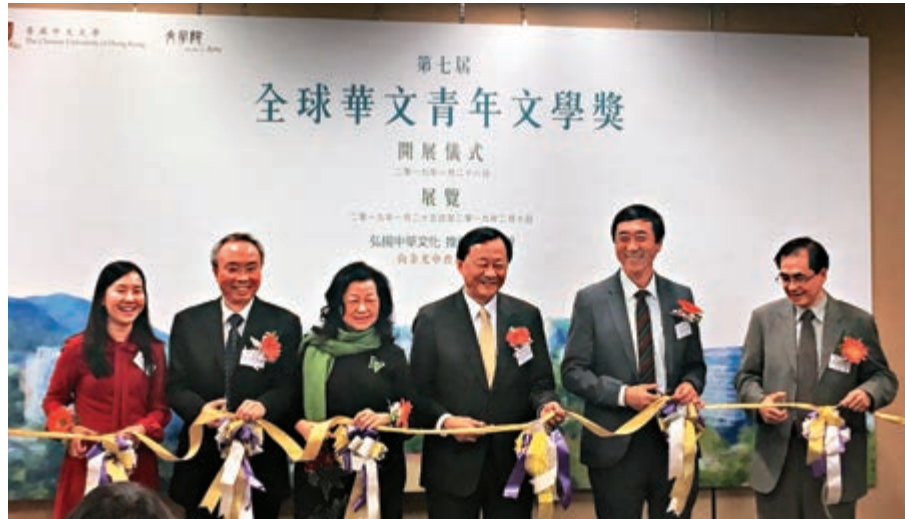
▲眾嘉賓為第七屆「全球華文青年文學獎」揭幕剪綵