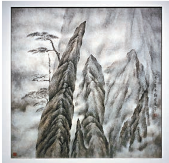
▲新埭強一九八〇年作《山、雲、松》（91×91公分）