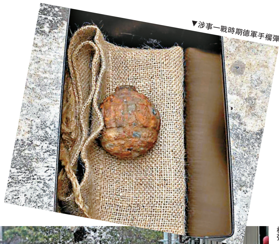
▼涉事一戰時期德軍手榴彈

卡樂B廠房驚現手榴彈！將軍澳工業邨卡樂B廠房，昨晨有工人為一批從法國運港的薯仔進行篩選工序時，發現一個被泥封住的疑似手榴彈，經警方爆炸品處理課人員檢查後，證實為一枚第一次世界大戰時期由德國製造的手榴彈。專家認為它狀況不穩定，即場以水壓處理方式成功引爆。警方初步相信，事件不涉刑事或恐襲成分。