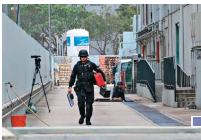
▲警察爆炸品處理組人員正在進行引爆前處理工作