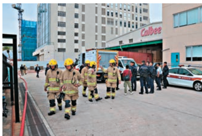
▲大批警察爆炸品處理組人員及消防員在現場處理