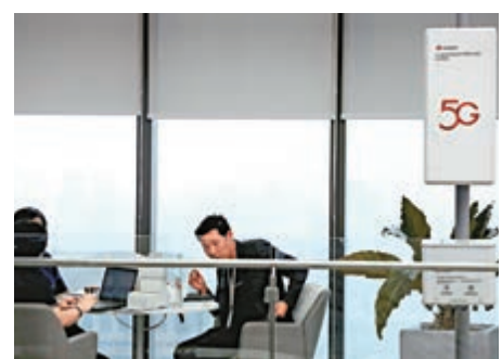
▲在泰國曼谷一個展覽外拍攝的華為5G設備

已經出貨超2萬5000個5G基站，簽訂了30個5G合同，在這30份合同中，18個來自歐洲，中東9個，亞太3個。