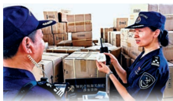
海關關員正在查驗涉嫌侵權的產品。資料圖片