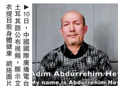
▶10日，中國國際廣播電台土耳其語公布視頻，顯示艾衣提目前身體健康。

發言人表示，中國新疆教培中心根本不是所謂的「集中營」。恐怖主義和極端主義是人類文明的公敵，也是國際社會共同的敵人。新疆立足本地區實際，堅持「一手抓打擊、一手抓預防」，依法設立職業技能教育培訓中心（簡稱「教培中心」），開展多種形式的幫教工作，最大限度地團結教育挽救絕大多數有違法行為或者輕微犯罪行為的人員，避免其成為恐怖主義和極端主義的另一種受害者和犧牲品。