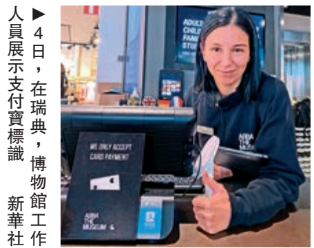
▶4日，在瑞典，博物館工作人員展示支付寶標識。