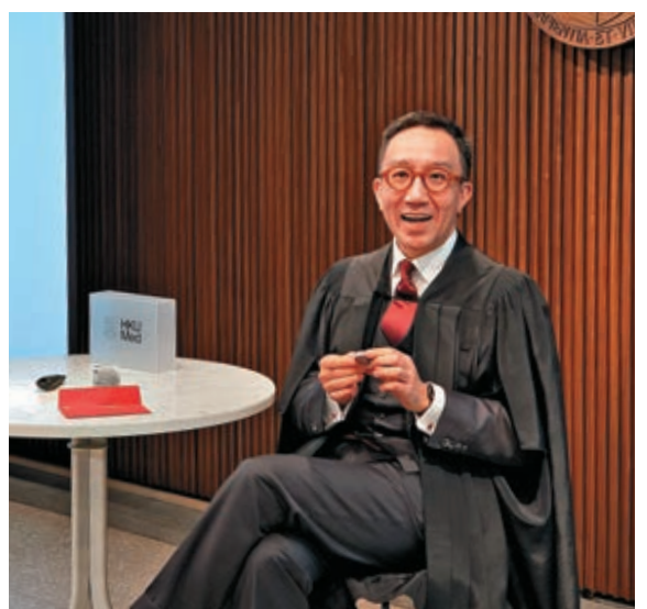
▲香港大學醫學院院長梁卓偉批評醫管局「開會文化」有增無減

【大公報訊】記者楊州報道：公立醫院每遇流感高峰病房都「爆滿」，前線醫護壓力「爆煲」，香港大學醫學院院長梁卓偉炮轟醫管局「開會文化」有增無減，開會一次變三、五次，時間都花在架構管治上，形容情況「過分」與「過火」。他期望醫管局拆牆鬆綁，善用醫護資源。有前線醫生稱，單為了增添打印機，前後便花了兩年時間。