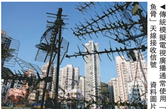
▲傳統模擬電視廣播通常使用「魚骨」天線接收信號

邱騰華表示，為讓他們及早準備更換電視，政府提早21個月公布終止模擬電視服務的決定。外國經驗在終止模擬廣播時，政府會為受影響用戶提供機頂盒，邱明言香港可做得更好，在政府資助計劃下，受影響用戶可選擇加裝機頂盒，或購置數碼電視機。