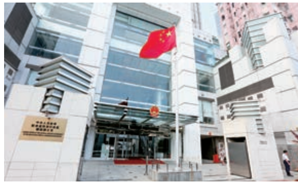
▲中聯辦主任王志民及六名副主任、秘書長及各部部長都將出席下週二的春茗團拜

【大公報訊】記者馮瀚林報道：中聯辦發函邀請全體立法會議員下周二（元宵節）到中聯辦大樓春茗團拜，中聯辦主任王志民及六名副主任、秘書長及各部部長都將出席。多個政黨認為，溝通有助減少誤會，不同黨