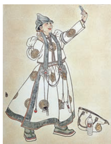
▲圖力古爾作品《陽光下》