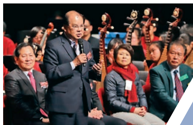
▲國際青年音樂節閉幕音樂會主禮嘉賓政務司司長張建宗致辭