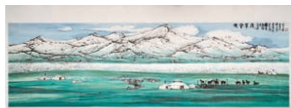
▲內蒙古寫生團合作作品《天堂草原》