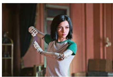
▲《銃夢：戰鬥天使》上周香港票房登頂