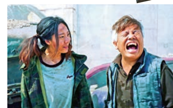
▼如夢（左）在挫折中成長

有趣的是，周星馳之所以成為喜劇之王，正是他那一套本色、乃至程式化的獨特表演節奏，深深地拉住了觀眾的笑點。而當他只執導筒，不再在幕前演出，那些真正受過科班史坦尼夫斯基體系訓練的內地演員，在他執導的作品之中，總是無法複製這種喜劇節奏。