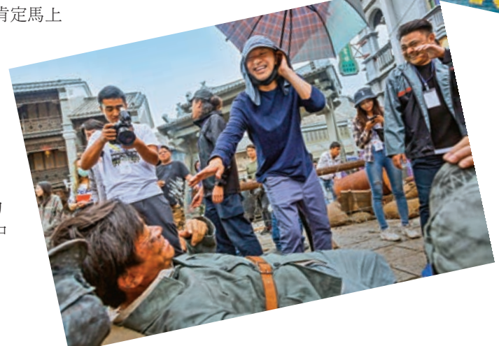
◀周星馳（中）的新片可說十分勵志