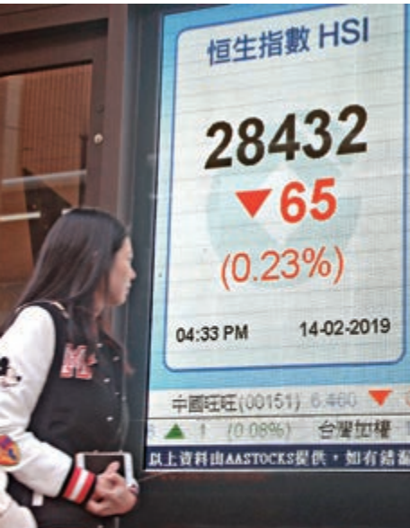
▲港股連升多日後出現回吐，內房股跌勢明顯（中新社）