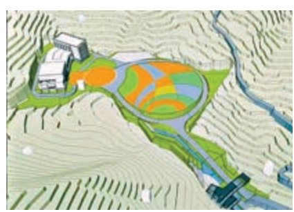
▲璧山空間太陽能電站實驗基地項目鳥瞰圖

中國工程院院士、重慶大學教授楊士中舉例說，每平米的太陽能電池在西北地區中午太陽直射時約能產生0.4千瓦電力，在多霧的地方至多0.1千瓦。在平流層每平米發電功率可達7千瓦至8千瓦，在地球同步軌道上，發電功率可達10千瓦至14千瓦。