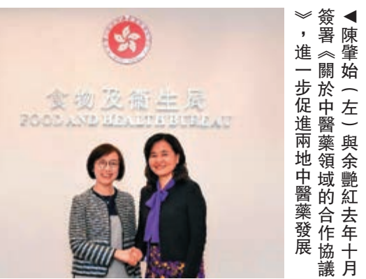
▲陳肇始(左)與余艷紅去年十月簽署《關於中醫藥領域的合作協議》，進一步促進兩地中醫藥發展

行政長官林鄭月娥在早前發表的施政報告中，更加積極提出推動中醫藥發展，並指會通過新的認證服務促進發展，促使香港成為中醫藥「走向國際化的平台」。 為實踐承諾，食物及衛生局局長陳肇始與國家衛生健康委員會黨組成員、兼國家中醫藥管理局黨組書記、副局長余艷紅，於去年10月簽署《關於中醫藥領域的合作協議》，加強雙方在中醫藥領域合作，進一步推動香港與內地的中醫藥進程。