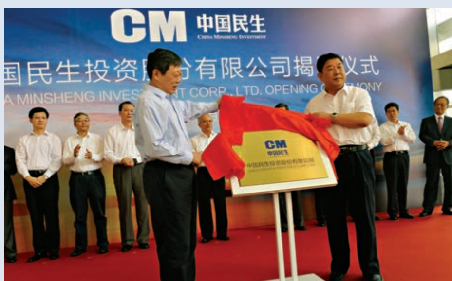
▲年初至今，已有逾十隻企業債券實質性違約，中民投為其中之一；圖為中民投於二〇一四年在上海揭牌儀式現場

中國央行副行長潘功勝此前指出，個別債券違約是風險的釋放，隨着債券市場打破剛性兌付，風險的暴露有利於債券市場的健康發展，這對強化市場參與者信用風險意識、完善市場定價、強化市場約束等來說都是好事情。