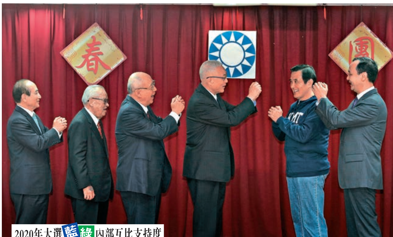
▲國民黨主席吳敦義（左四）、前「立法院長」王金平（左）、台灣地區前領導人馬英九（右二）、前「台北市長」朱立倫（右）等人，互相拱手致意 資料圖片

媒體隨後又問現在也有一種說法，就是韓國瑜參選大選，妻子李佳芬來選高雄市長，韓國瑜說：「啊！別再開玩笑了。」還反說記者在講童话故事、天方夜譚。