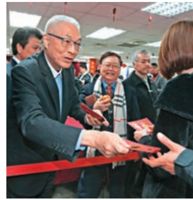
▲國民黨主席吳敦義有意參選，但仍未正式宣布

黨務人士表示，只是過去都只有黨主席一人登記參加大選，唯一一次例外，是前新北市長朱立倫擔任黨主席時，由於他不參加大選，才有後來前主席洪秀柱、前衛生署長楊志良參選，但最終只有洪秀柱一人跨過黨員連署門檻，也就是國民黨沒有真正辦理過初選。