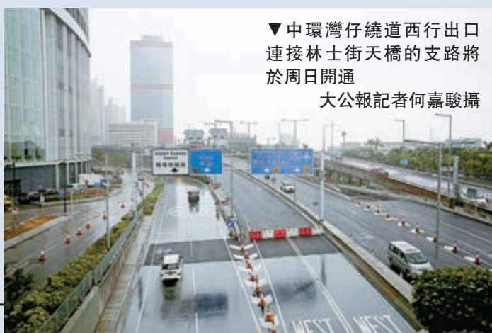
▼中環灣仔繞道西行出口連接林士街天橋的支路將於周日全面通車