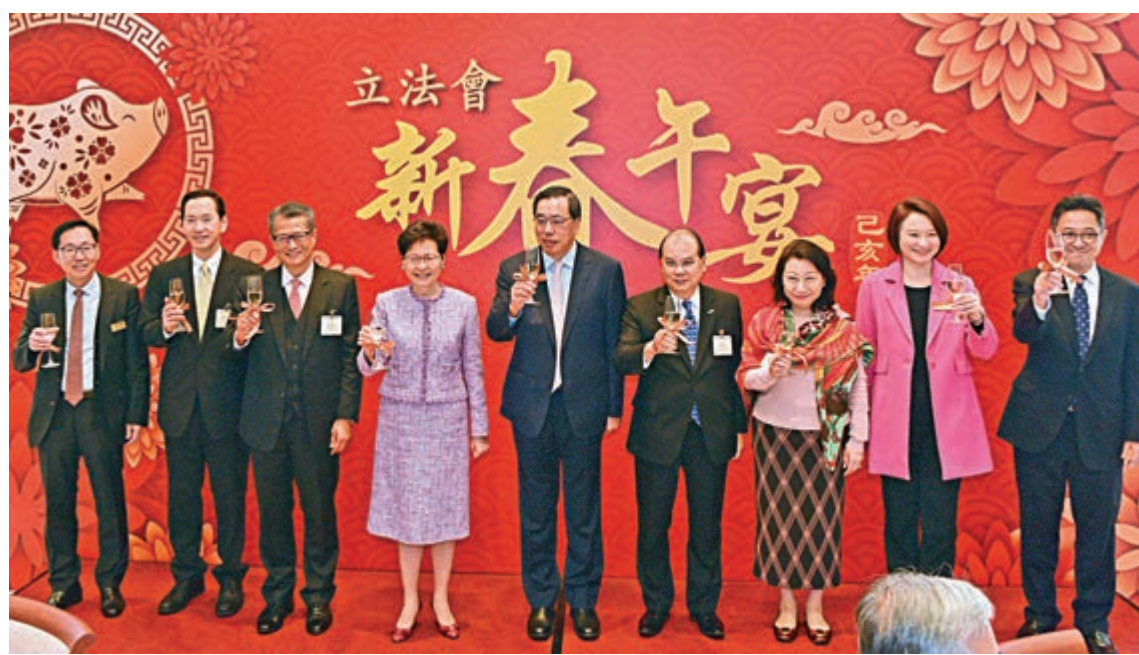
▲行政長官林鄭月娥昨日帶領司局長、常任秘書長及政府部門首長等高級官員，應邀出席立法會新春午宴

梁君彥表示，暫時未能確定是否有反對派議員參加，呼籲他們珍惜這一難得的機會，積極回應中聯辦善意邀請、加強溝通交流。