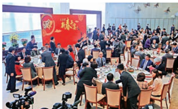
▲反對派議員玩杯葛，拒絕出席新春午宴

全體立法會議員，在中聯辦大樓內舉行春茗團拜。立法會主席梁君彥昨日接受記者採訪時表示，中聯辦在午宴之前，特地設置上午十一時半至十二時半的一小時「茶敘」環節，不預設話題，供各方自由溝通，各議員可藉此機會，就各自關注的領域與中聯辦官員直接交流。