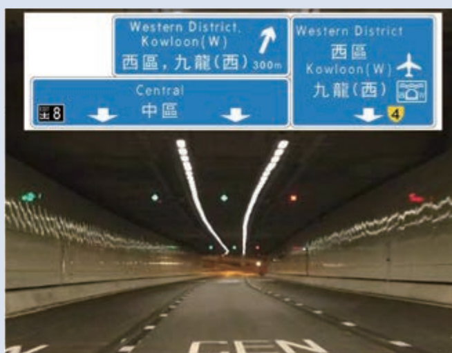
▲隧道內將增設新路牌指示