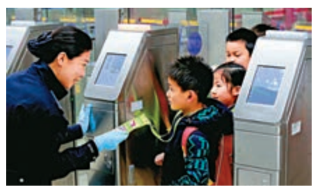
▲深圳邊檢民警正在快速驗放跨境走讀學童。

員開展密集地面巡查，提前開足學童專用查驗通道，確保學童隨到隨檢，盡量減少學童在口岸停留時間。