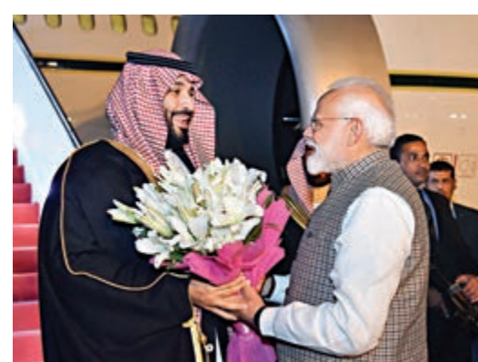
▲19日，印度總理莫迪（右）在機場迎接沙特王儲本·薩勒曼

沙特是印度最大的原油供應國。印度外交部上週曾表示，兩國將在此基礎上拓展能源領域以外的合作，雙方政府將共同打造戰略夥伴關係。此外，兩國還將簽署一項協議，建立沙特—印度最高協調委員會。