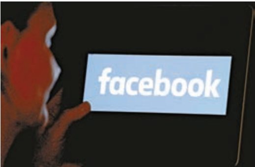
▲Facebook因泄露用戶數據或被罰款157億

據美聯社、《華盛頓郵報》報道：美國社交巨頭Facebook的「數據門」醜聞餘波持續，有消息人士指出，美國聯邦貿易委員會（FTC）以Fb違反2011年達成的用戶私隱保護協議為由，欲向其開出一筆破紀錄的罰款，金額或以20億美元（約157億港元）起跳。目前，雙方正就此進行談判，如果談判破裂，FTC可能會將Fb告上法庭，上演一場殊死搏殺。