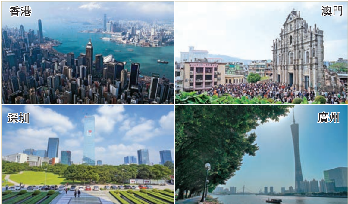
▲《粵港澳大灣區發展規劃綱要》提到，以香港、澳門、廣州、深圳四大中心城市作為區域發展的核心引擎

延伸閱讀： 《粵港澳大灣區發展規劃綱要》全文： https://www.bayarea.gov.hk/filemanager/tc/share/pdf/Outline_Development_Plan.pdf