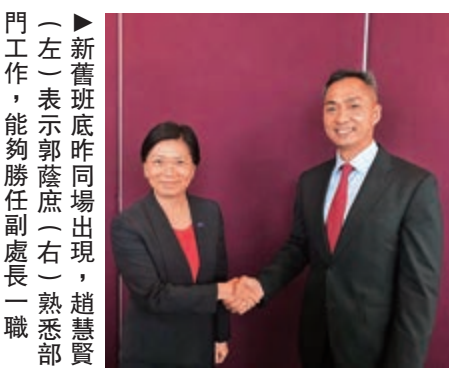
▲新舊班底昨同場出現，趙慧賢（左）表示郭蔭庶（右）熟悉部門工作，能夠勝任副處長一職

【大公報訊】記者周峻峯報導：政府昨宣布委任警務處副處長趙慧賢為新任申訴專員，接替即將卸任的劉蕪卿，四月一日起生效，任期五年。行政長官林鄭月娥