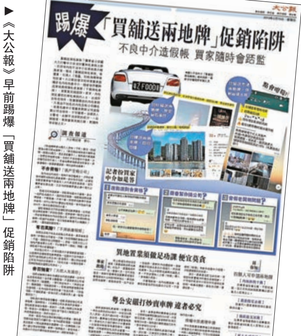
《大公報》早前踢爆「買舖送兩地牌」促銷陷阱。