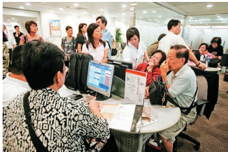
◀有一點估計估計：升市未完，更不會「玩完」，但有調整在所難免，再上所遇阻力更大