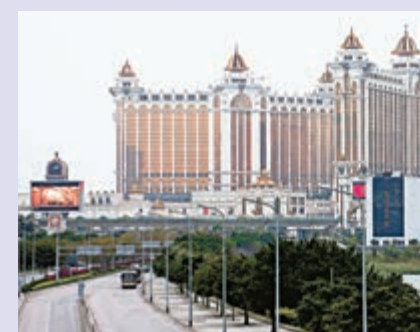
▲銀河娛樂2018年特別息料介乎50至90仙

保利協鑫晶圓料減產避虧損 麥格理日前發表研究報告，將保利協鑫(03800)評級由「跑贏大市」下調至「跑輸大市」，目標價由1.2元大幅下調至0.63元，主因預期多晶矽市佔率會下跌，因單晶矽的使用量提高，其2019至2020年每股盈利較其他券商預期低63%及24%，相信其高能效、強勁模塊及平均價格會超越多晶矽/多晶矽，預期晶圓的毛利會收窄。