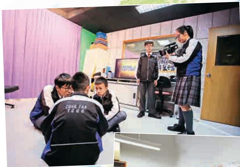
▲學生參與減罪短片創作比賽，重演按欺負大雄和叮噠的「電騙」奇案