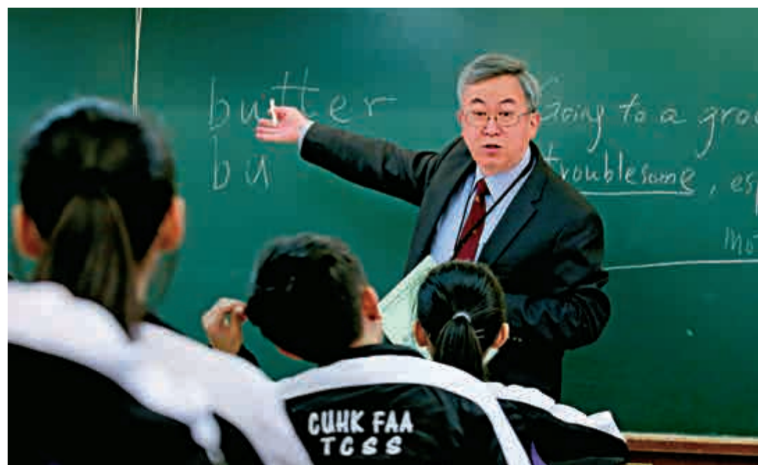
▲由牛油飛（Butterfly）講到公牛（bull）等連串與牛相關的單詞，伍德基讓學生感受不一樣的英語學習法

打開張煊昌中學網頁，設有「語文閱讀」欄目，一鍵即通香港教育城、中國日報（香港版）、香港教育局的「書唔凶」閱讀網，還有英國文化協會的英語在線，以及Discovery和National Geographic，讓天水圍的青少年，與港島和九龍的學生在同樣的免費網上英語資源網，展開學習之旅。這趟學習之旅收穫如何，則視乎學生是否把握機會不斷求進，以及持之以恆。