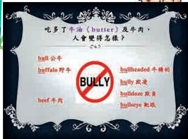
▲伍德基不時將這些學習方法整理成專欄，上載臉書「放眼元朗」