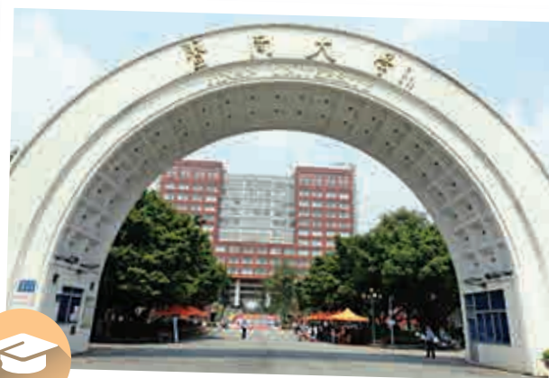
▲暨南大學設有五個校區，分別位於廣州、深圳及珠海三地

為擴闊學生國際視野，學校亦積極開展國際交流合作，並已與五十個國家、港澳台地區的288間高等院校，以及不同的文化、科技機構簽訂了學術交流合作協議。每年均選拔數百名優秀學生到國外大學交流學習。