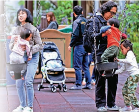
▲稅務負擔減輕，中產家庭生活更開心