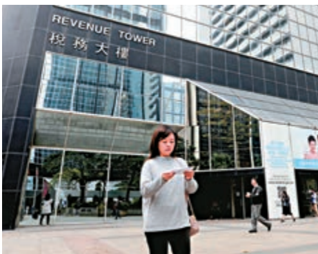
▲約90萬名中產高薪納稅人稅款寬減額比去年減少4000元至10000元不等

財政司司長陳茂波坦言，今個年度盈餘由1400億跌到587億元，退稅及差餉寬免要和盈餘匹配，一次性措施力度亦要減輕，否認向中產「開刀」。政府消息人士形容，「派糖」規模屬「正常範圍」，與前幾年相若，只是去年有641億元屬近年最多，去年之前三個財政年度都不超過400億元，退稅上限都是2萬元。