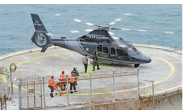
▲長洲停機坪於上周五重開，首宗任務接送一名長者至港島區醫院

港人陳女士因人際關係問題來打小人，她承認這是迷信行為，但「當你好激氣，打完個人會舒服啲，而且又唔係日日打。」她表示，有專業人士燒香、稟告及祭白虎等完整程序，打完後，隔日真係見效。