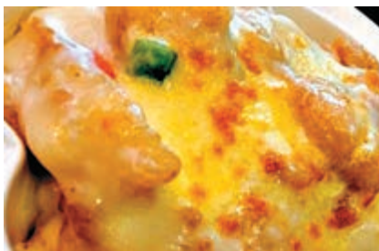
▲坊間食肆的「石斑飯」常被質疑是否用石斑塊

譚鳴向魚類專家、香港魚類學會會長莊桂華請教，龍脷和石斑均屬海水魚，而一般食用的鯰魚是淡水魚，鯰魚魚身前半段為圓筒形，後半段較扁身，肉質不算太實；龍脷偏扁身，肌肉幼嫩，口感偏滑溜，帶甜味；石斑一般以養殖的沙巴躉為主，肉質較結實。三者之中，鯰魚便宜得多。