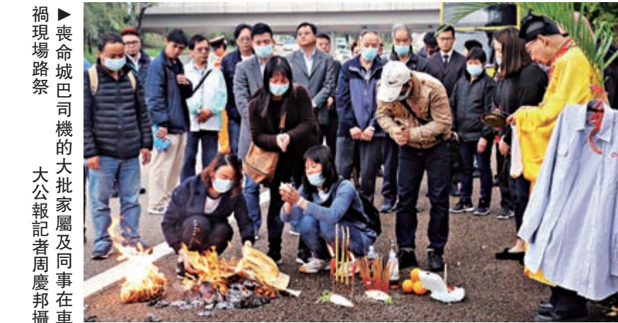
►喪命城巴司機的大批家屬及同事在車禍現場路祭

西隧公司指出，現場設置了151個電子鏡頭覆蓋管道內及隧道範圍，涉事貨車故障地點屬須180度轉動以改變攝錄方向的鏡頭攝錄範圍，但不幸在事發時，電子鏡頭未有轉動到肇事方向。