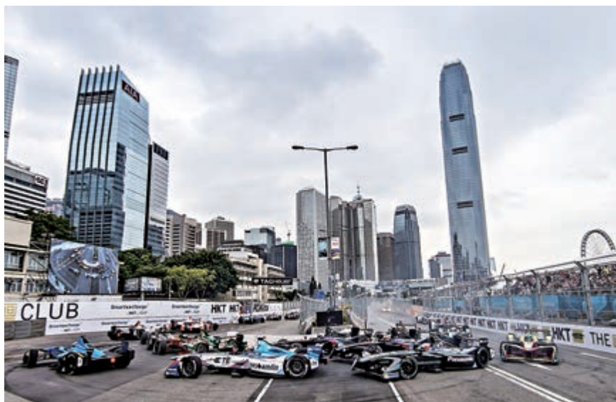
▲本周末在中環舉行的Formula E或要「打水戰」