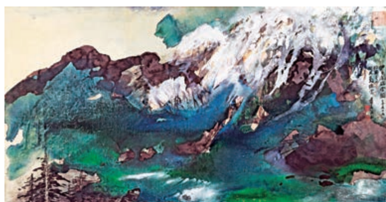
▲估價五千萬元至七千萬港元的張大千《伊吾閩瑞雪圖》，四月二日在香港拍賣

【大公報訊】記者黃璇報導：香港蘇富比二〇一九年春季拍賣會將於三月二十九日至四月三日在香港會議展覽中心舉行，四月二日的「中國書畫」專場，將有近二百五十幅近現代名家作品上拍，以首度面世的張大千潑彩山水鉅製《伊吾閩瑞雪圖》（編號1415，101×196公分）最為矚目，估價五千萬元至七千萬港元。