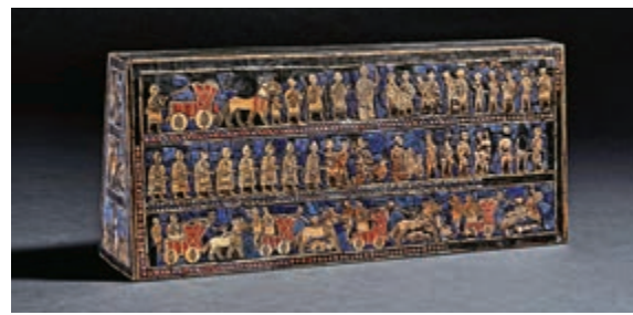
▲「百物看世界——大英博物館藏品展」將展出伊拉克的烏爾軍旗等二百六十件文物