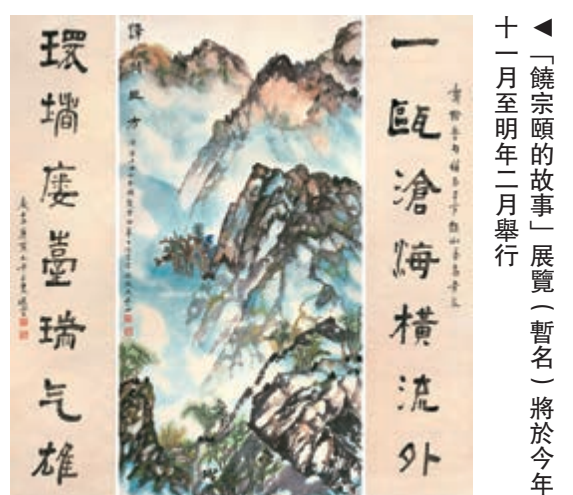
▲「饒宗頤的故事」展覽（暫名）將於今年十一月至明年二月舉行