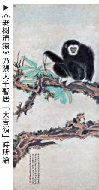
▶《老樹清猿》乃張大千畫「大吉嶺」時所繪