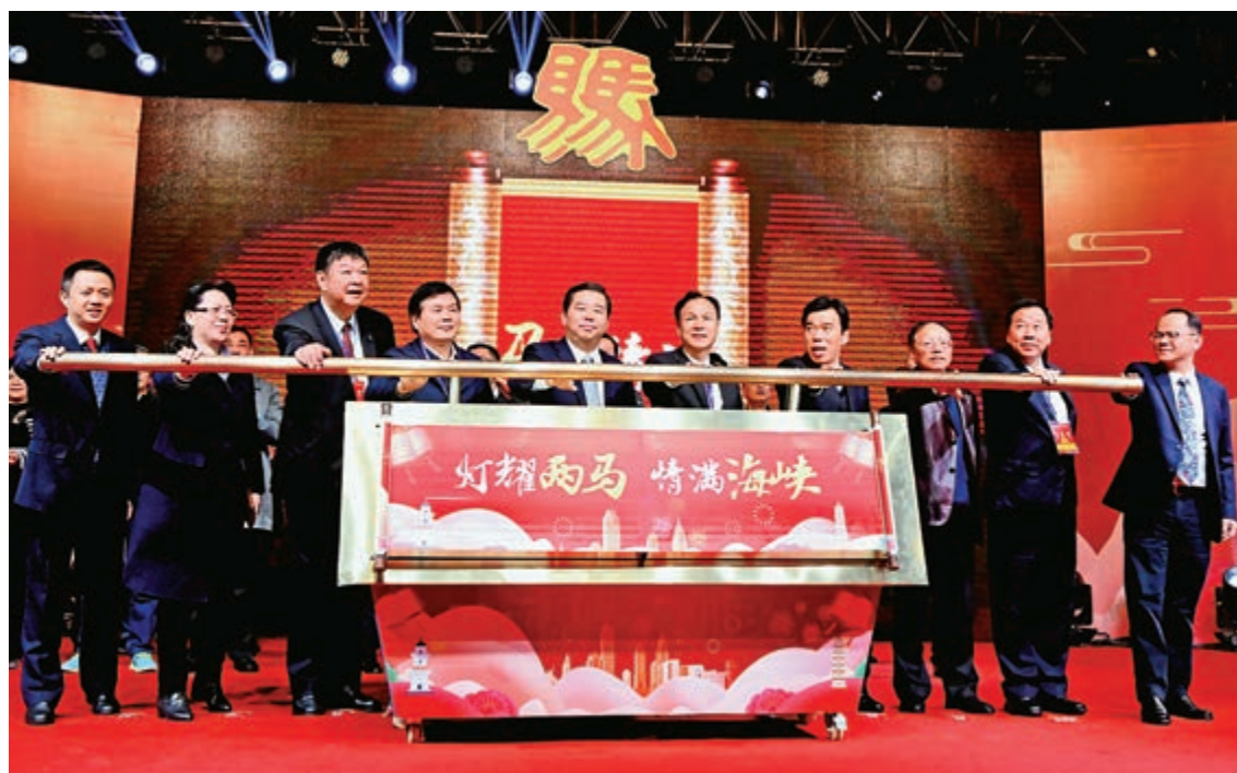
福建和馬祖交流密切，而「新四通」將進一步促進兩地融合發展。

據悉，早年馬祖因為戰地任務，所有建設都以軍事為主，基礎建設比較落後，後來台灣才開始重視外島建設，目前馬祖水電基礎建設還算完備。不過，隨著兩岸交流越來越緊密，馬祖旅遊人數倍增，飲用水問題逐步凸顯。對於馬祖的用水問題，福建省政府高度重視。今年1月，在福建官方提出「推動與金門馬祖通水通電通氣通橋」後，福州連江縣成立「連馬率先融合發展工作領導小組」，進一步加快連馬融合發展步伐，向馬祖供水的議題由此提上日程。