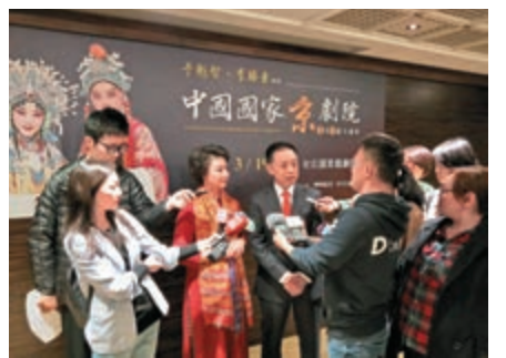
于魁智、李勝素在發布會上接受採訪。

【大公報訊】記者朱燁報道：3月19日至24日，由80人組成的中國國家京劇院台灣演出團將在台北兩廳院戲劇院開啓第23次台灣公演，六天將奉七台京劇經典大戲，與台灣及海內外同胞共享國粹盛宴。14日，中國國家京劇院第23次台灣演出新聞發布會上，著名京劇表演藝術家于魁智、李勝素、資深京劇導演孫桂元