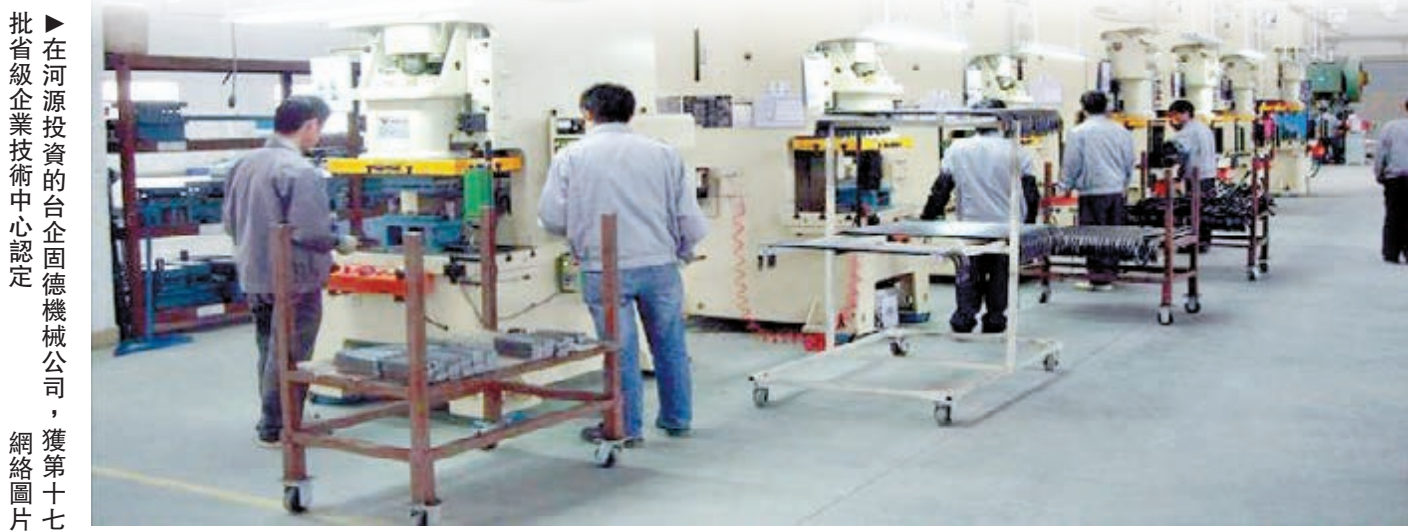
在河源投資的台企固德機械公司，獲第十七批省級企業技術中心認定。