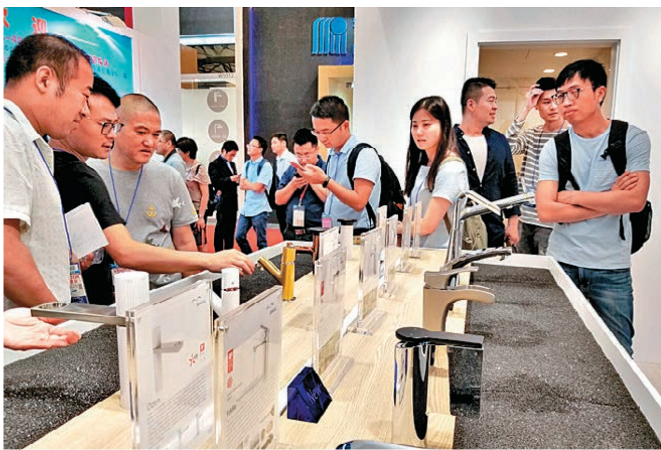
位於廣州的台企海鷗住工受惠於「惠台31條」迅速轉型升級。圖為去年國際廚衛展上海歐住工的展位。