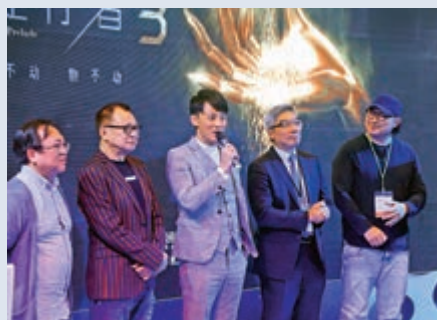
▲《使徒行者3》主創人員

第四十三屆香港國際電影節由三月十八日至四月一日舉行。一連十五天選映來自六十三個國家和地區超過二百三十部電影。門票現正發售，公眾可透過網上(www.hkiff.org.hk)訂票，亦可在城市售票網及快達樂購買。