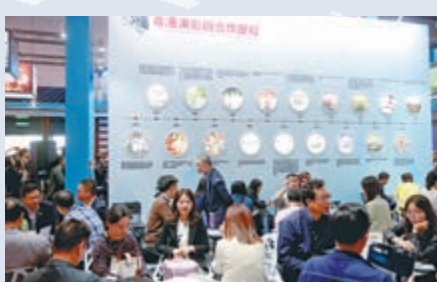
▲展館特別設置了粵港澳影視合作歷程專題