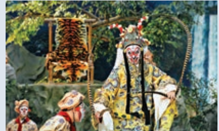
▲京劇電影《大鬧天宮》劇照 ▲梁國浩(左起)、羅江、梁建勇、陳冬、陳立華、吳良好主禮開館儀式

本次活動由中共福建省委宣傳部、福建省電影局主辦。香港中聯辦副主任陳冬、宣文部副部長羅江，中共福建省委常委、秘書長、宣傳部部長梁建勇，福建省委宣傳部副部長、福建省電影局局長陳立華，福建省委辦公廳副主任施宇輝，全國政協常委吳良好、香港電影製片家協會主席洪祖星、香港銀都機構董事長兼總經理陳一奇、台灣電影製作發展協會理事長吳高雄、香港貿易發展局助理總裁梁國浩等嘉賓同二十多家福建龍頭電影企業代表出席展會。