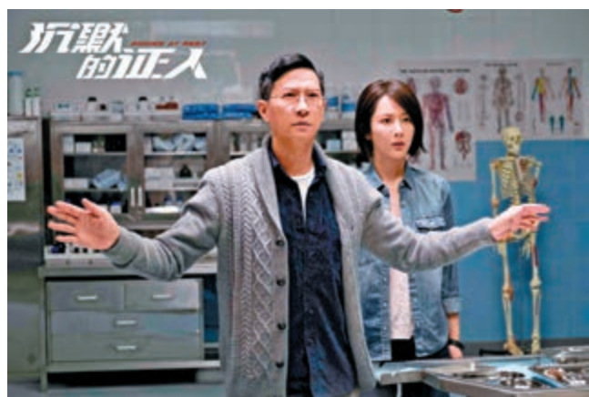
►郭富城介紹今屆國際電影節內容