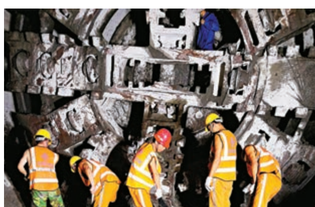
▲深圳地鐵2號線東延線仙湖路站至蓮塘口岸站盾構區間貫通

【大公報訊】記者黃仰鵬深圳報道：直達蓮塘口岸的深圳地鐵2號線東延線20日實現全線貫通，正式進入軌道鋪設及車站裝飾裝修階段。據介紹，該工程將於明年年底迎來開通。