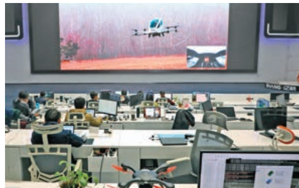
▲廣州億航智能技術公司自主研製全球首款可載客無人駕駛飛機，並於去年初公開測試視頻

近年廣州創新創業生態環境持續優化，如今科技創新企業超過20萬家，且5億元（人民幣，下同）以上工業企業實現研發機構全覆蓋。技術合同成交額從2017年的357億元翻番至2018年的719億元。廣州高新區納入科技部世界一流高科技園區建設序列，廣州開發區在國家級經濟技術開發區考核評價榜單中科技創新排名全國第一。廣州還湧現一批重大科技成果，包括21項成果獲國家科學技術獎，佔廣東獲獎項目47%；「我國首次海域天然氣水合物試採」入選中國十大科技進展；華南理工大學承擔的「分子聚集發光」基礎科學中心項目成爲國家自然科學基金委迄今最大資助項目。一批高水平創新人才和團隊成長壯大，施一公、王曉東、袁宇宇等成爲廣州創新的標桿領軍人物，廣州生物醫藥與健康研究院院長裴端卿入選歐洲分子生物學組織外籍成員。