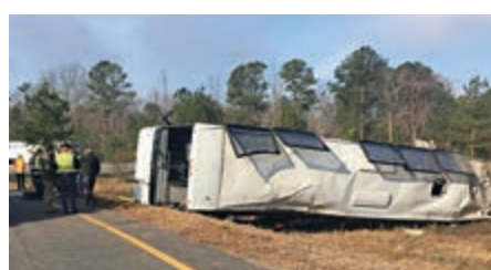
▲美國弗吉尼亞州一輛旅遊巴士19日翻側

弗吉尼亞州警方透露，事故巴士載有司機在內共57人，原定由奧蘭多駛回紐約。當地時間凌晨5時22分左右，該巴士行駛至喬治王子縣95號州際公路的出口匝道時，在大霧天氣下失控翻側並衝出公路。警