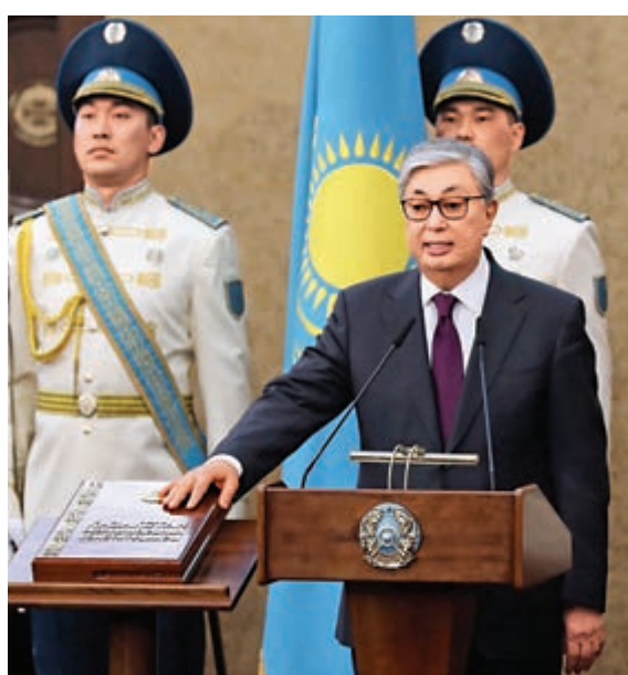
▲哈薩克斯坦新總統托卡耶夫20日就職

【大公報訊】據法新社、美聯社及新華社報道：哈薩克斯坦前總統努爾蘇丹·納扎爾巴耶夫19日辭職卸任，哈薩會上院議長托卡耶夫翌日(20日)宣誓就職，接任該國臨時總統職務。他同時提議將首都更名為努爾蘇丹並獲議會通過。