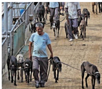
▲去年澳門賽狗場關閉，大批格力犬待人領養，漁護署曾有特別安排，抵港狗隻不用強制「坐狗監」

發言人強調，狂犬病潛伏期可達一年，恆常隔離檢疫措施是必須的。該署會密切留意世界動物衛生組織的動物疫情最新通報，適時調整安排。