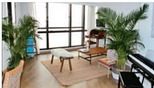
致，消防安全卻是大隱憂 ▲豪宅無牌民宿裝修雅

新修訂雖然不排除「民宿」或以其他方式提供短期出租住宿設施的牌照申請，政府更表明「任何處所，只要符合消防及樓宇安全方面的規定，均可申請牌照，合法經營。」然而，對傳統意義上的「民宿」仍然是規管甚嚴。政府可以考慮將「民宿」與「酒店」和「賓館」三者分開，視作第三種旅遊住宿模式，用較簡單登記方式規管，這更符合各方利益。