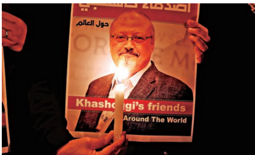
▲卡舒吉遇害後，許多民眾自發擁護他