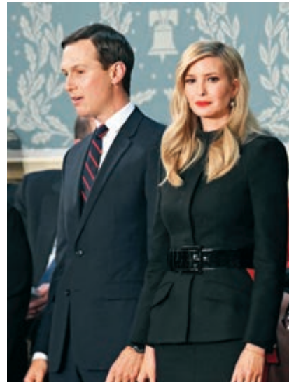
▲美國第一女兒伊萬卡（右）及其丈夫庫什納

其丈夫庫什納在內的25名白宮職員，在未通過背景檢查的情況下依然獲得安全許可，這凸顯了當局濫發安全許可的現象嚴重。