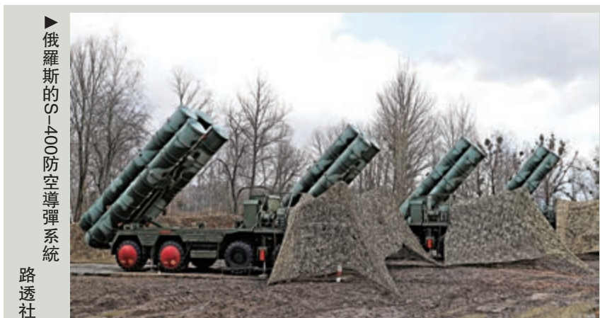
俄羅斯的S-400防空導彈系統