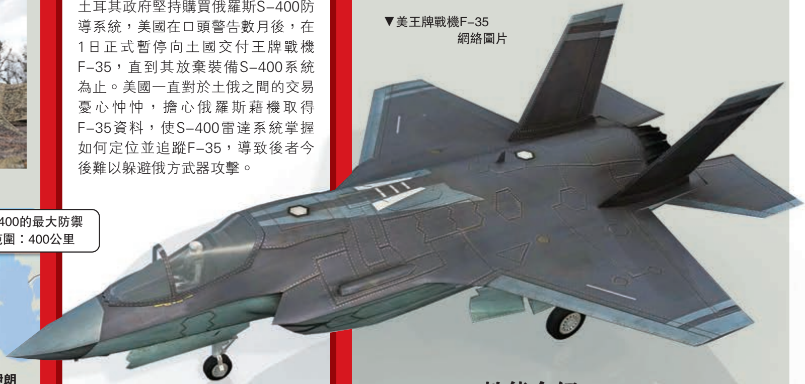
▼美王牌戰機F-35

不過，面對美國逼埃爾多安站隊的攤牌之舉，他是否能承受失去100架F-35戰機的風險，將S-400購買計劃進行到底，尚不能下定論。土國自2002年前向F-35研製計劃已投資了12.5億美元，自然不希望兩手空空。另外，土國首都安卡拉日前地選變天，顯示出埃爾多安的執政基礎有所動搖，這或許會影響他未來的外交政策。