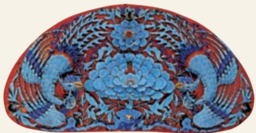
▲故宮博物院藏風吹牡丹紋點翠頭面