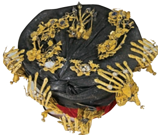
▲溫僖貴妃金累絲鳳釵