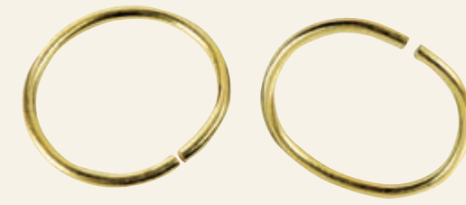
▲溫僖貴妃素金手鐲