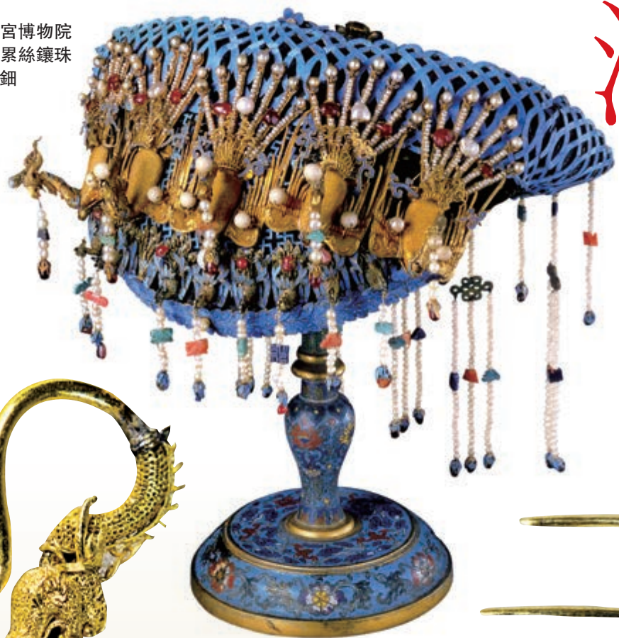
▶故宮博物院藏金累絲鑲珠寶鳳釵

國家主席習近平今年三月二十一日至二十三日訪問意大利，其間兩國領導人共同見證，意方將查獲的非法流失七百九十六件套中國文物藝術品返還中方。一時間流失海外中國文物問題，又引發社會關注。