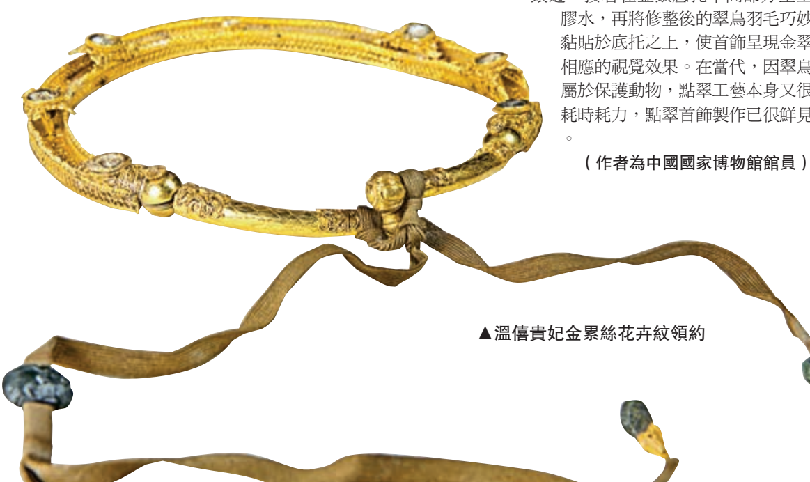
▲溫僖貴妃金累絲花卉紋領約