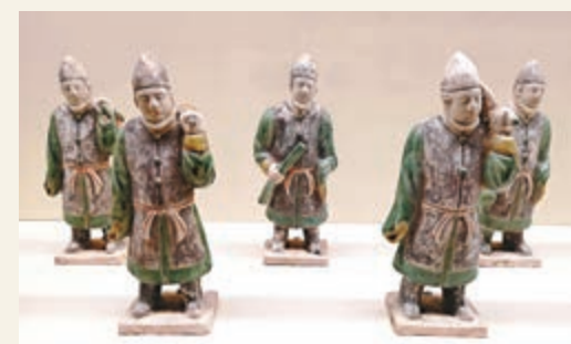
▲「眾志成城 守護文明」展覽現場拍攝的明代陶俑