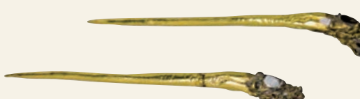
▲溫僖貴妃鑲金龍首簪