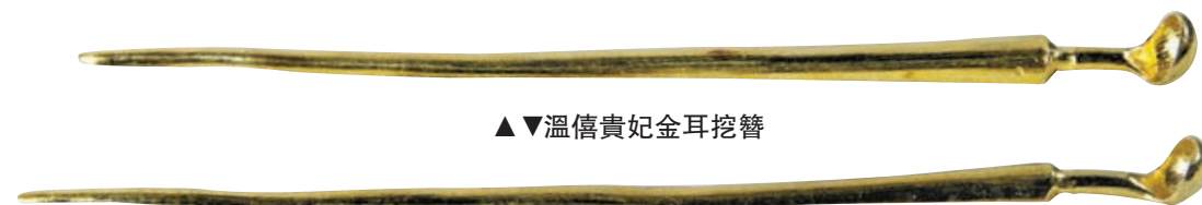
▲▼溫僖貴妃金耳挖簪