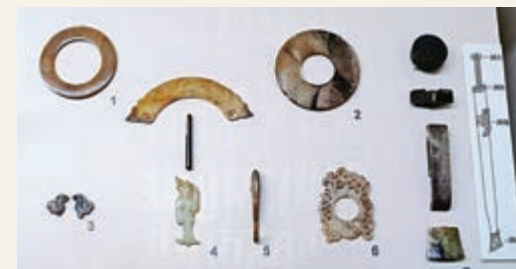
▲曾於園博舉行的「眾志成城 守護文明」展覽現場拍攝的西漢海昏侯墓出土玉飾