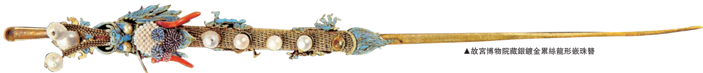
▲故宮博物院藏銀鍍金累絲龍形狀簪