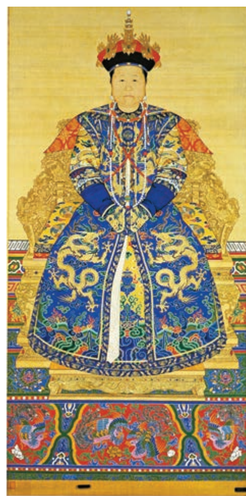
▲故宮博物院藏孝莊文皇后朝服像，帶禮制首飾