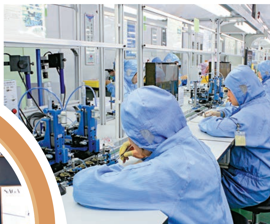
▲得利從2009年至今僅升級生產線便投入5000萬元，圖為得利自動生產線