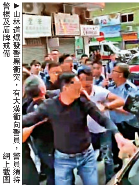
警棍及盾牌發黑衝突，有大漢衝向警員，警員須持網上截圖

【大公報訊】突發組報道：大批疑有黑幫背景大漢前日在尖沙咀山林道馬路鬧事，更公然挑釁巡經的反黑組探員，警方為挫黑幫氣焰，當晚即採取行動，拘捕五名涉案黑漢。警方強調，打擊黑社會絕不手軟，絕不容許任何挑戰警方及公然擾亂公眾秩序的行爲。而在網上流傳相關公然