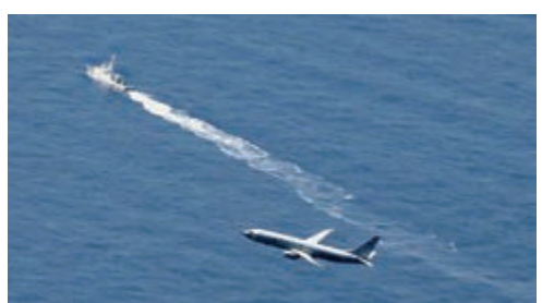
▲日本自衛隊艦艇與美國軍機10日聯合搜索墜毀的F-35戰機

9日下午7時27分，日本航空自衛隊一架F-35A尖端隱形戰機從三澤基地起飛前往訓練，約28分鐘後從雷達上消失，機上一名40多歲的機師失蹤。空自搜救機、海上自衛隊護衛艦和海上保安廳巡邏船等連夜展開搜尋，於當天深夜在青森縣外海發現了左右尾翼的一部分，研判戰機已經不幸墜毀。