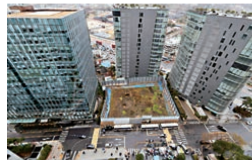
▲日本駐韓國大使館至今未動工