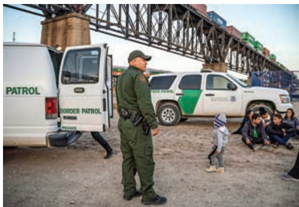
▶美墨邊境的邊檢人員攔截非法移民

此前CNN報道指，尼爾森在被炒前，特朗普曾要求她實施更嚴格、範圍更廣的「零容忍」政策，例如在難民口岸按合法程序申請避難時，就將父母和小童分開。特朗普相信這種做法能阻止非法移民家庭的湧入，尼爾森試圖告訴他這種做法會像上次一樣引起法律糾紛，其他白宮員工則認為這將帶來公關災難。