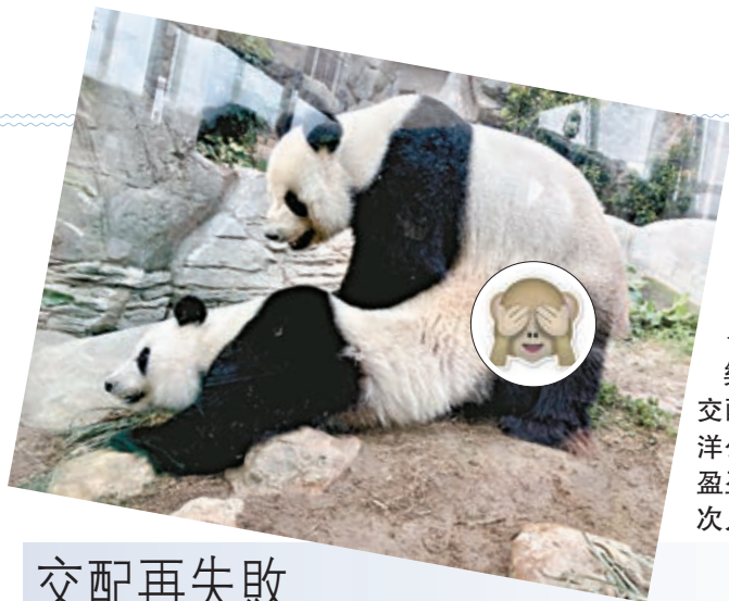
◀盈盈和樂樂又再自然交配失敗，海洋公園宣布為盈盈進行了三次人工授精

3 等一星期有結果 無論成功與否，大約一星期會收到銀行通知。成功開戶，客戶可到指定中銀香港分行領取通知書和中行ATM卡。提提大家，客戶需於60天內到分行領取，否則開戶憑證會退回。