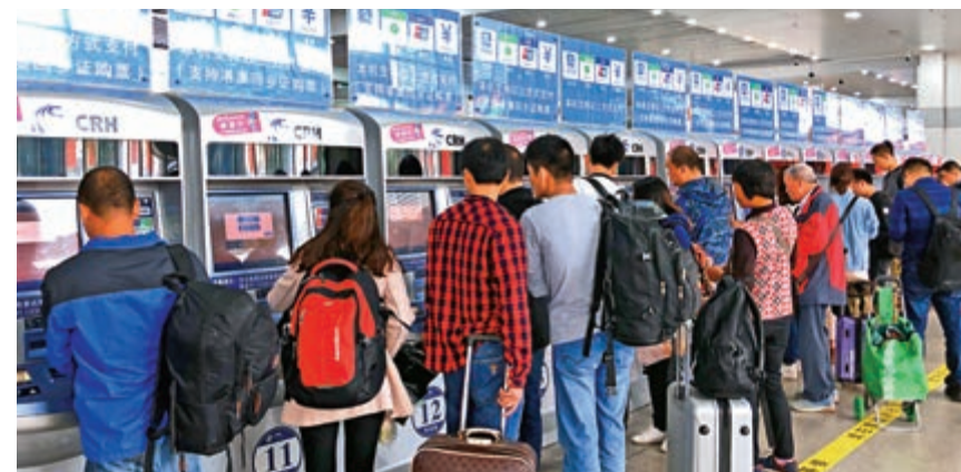
乘客在自動售票區排隊購買廣州城際車票

以票務服務為例，在「多元化支付」的基礎上，未來通過各類智能無感檢測設備，捕捉乘客標籤特徵，結合乘客「畫像」信息庫，實現乘客「無感支付」。據了解，今年年底，廣州將建立首個「智慧地鐵示範站」。