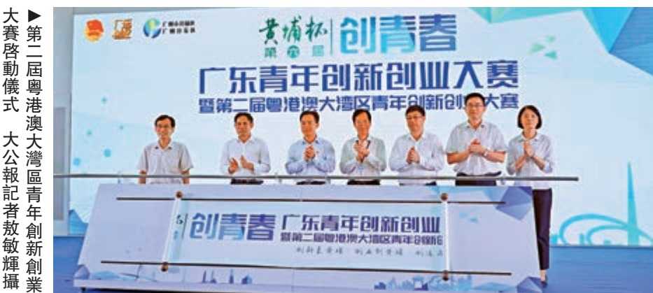
第二屆粵港澳大灣區青年創新創業大賽啓動儀式

大賽從即日起至6月30日接受報名，有意參賽者可登錄中青創網（www.zgqingchuang.com）報名，並通過「廣東創業」微信公眾號關注最新消息。