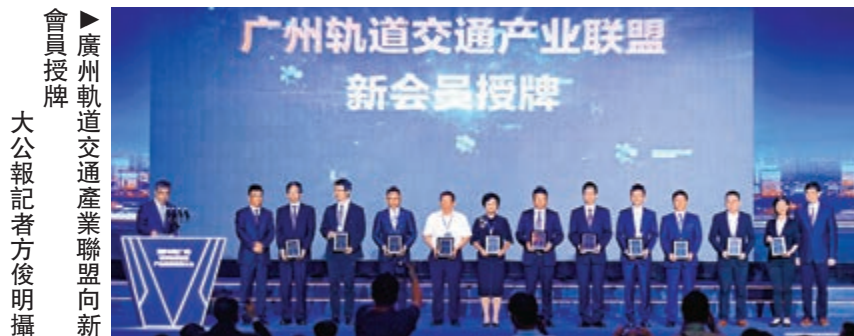
廣州軌道交通產業聯盟新會員授牌

《粵港澳大灣區發展規劃綱要》提出，加強港澳與內地的交通聯繫，推進大灣區城際客運公文化運營，推廣「一票式」聯程和「一卡通」服務。