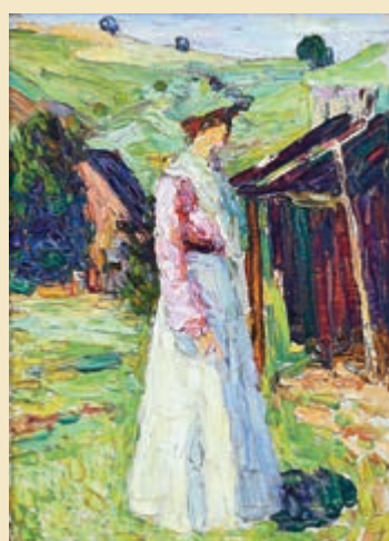
▲康定斯基一九〇二年作《Kochel-Gabriele Munter》，油彩畫布