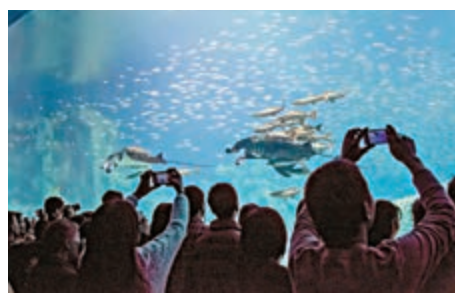
▲長隆海洋科學樂園每年接客逾五千萬人次

「現時該項目主體工程已經完工，正在進行外部鋼結構和部分內部區域裝修施工。因飼養海洋動物的需要，整個項目建