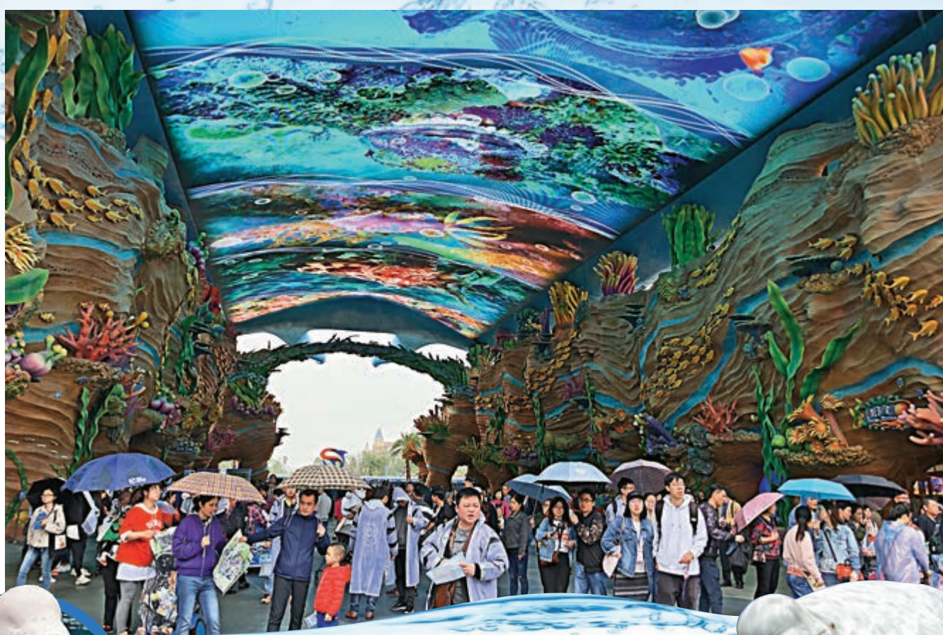
▲珠海長隆正進行二期擴建。到今年底，將打破四項健力士世界紀錄的全球最大海洋館落成並對外開放