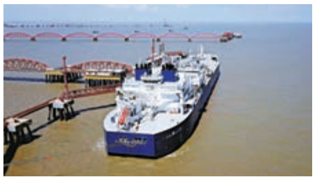
▲一艘載有亞馬爾LNG項目貨物的船隻抵達中國江蘇省南通市

中石油26日早間公告，全資子公司中國石油國際勘探開發有限公司(下稱「中油國際」)與俄羅斯諾瓦泰克公司於4月25日簽署北極LNG 2項目合作框架協議。中石油集團董事長王宜林和諾瓦泰克公司管理委員會主席列昂尼德·米赫爾松見證協議簽署。根據協議，中油國際將收購北極