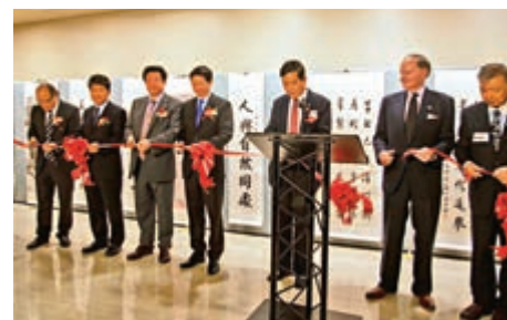
▲蘇士澍(右三)在開幕式上致辭，王林旭(左三)及與會嘉賓為開幕式剪綵

【大公報訊】記者張寶峰報道：作為聯合國2019年中文日慶祝活動的一部分，「蘇士澍、王林旭書畫展」24日晚在聯合國總部大廳隆重開幕。此次展覽共展出兩位書畫大師數十幅大型代表作，來自聯合國多個國家的外交官和本地華人華僑應邀出席了儀式。