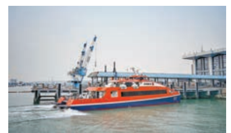
▲深珠「水上巴士」每天往返各8班

通中心，平均每隔15分鐘就有一班免費穿梭巴士往返於機場碼頭和航站樓之間，方便快捷。