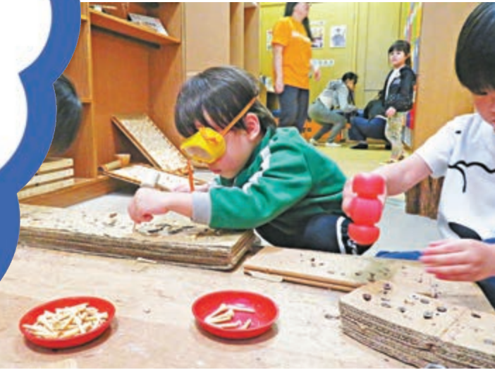
▲戴上木工裝備，開工喇！

有時候，家長們不難在遊戲中發現小朋友的創造力，然而，成人多被特定的玩法規限而扼殺了孩子的創意。今次為大家介紹一個親子好去處——智樂遊戲萬象館，這兒有各式各樣的遊戲，空中繩網、建築遊戲、磁石牆、氣球室等等，孩子可以任意玩，不須遵循規則，館方也不會貼上一張紙告訴你「正確玩法」。