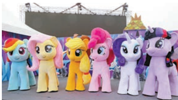
▲六隻小馬會在指定時間與大家見面