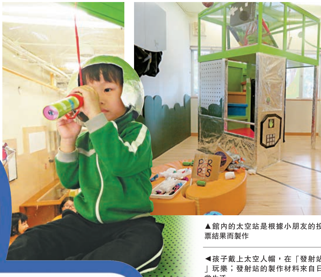
▲館內的太空站是根據小朋友的投票結果而製作